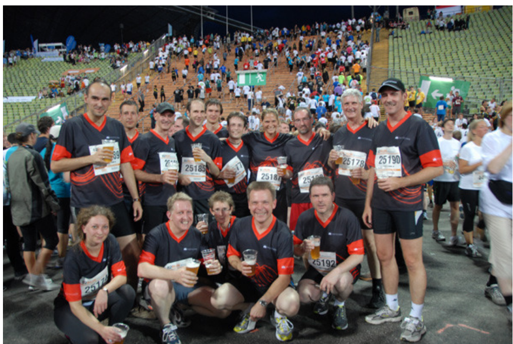
Und nach getaner Arbeit dürfen isotonische Getränke nicht fehlen.