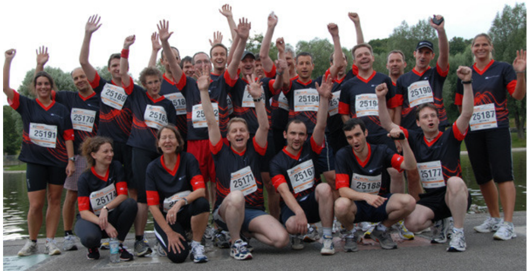
...schwappte die Begeisterung am See förmlich über.