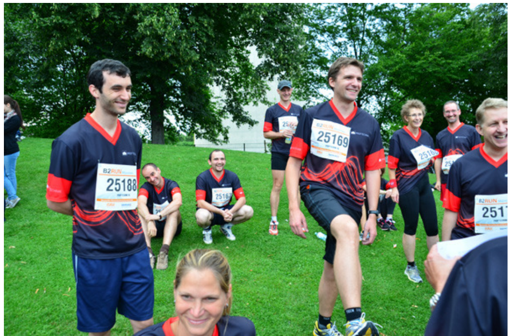
Vor dem Start: Aufwärmen!