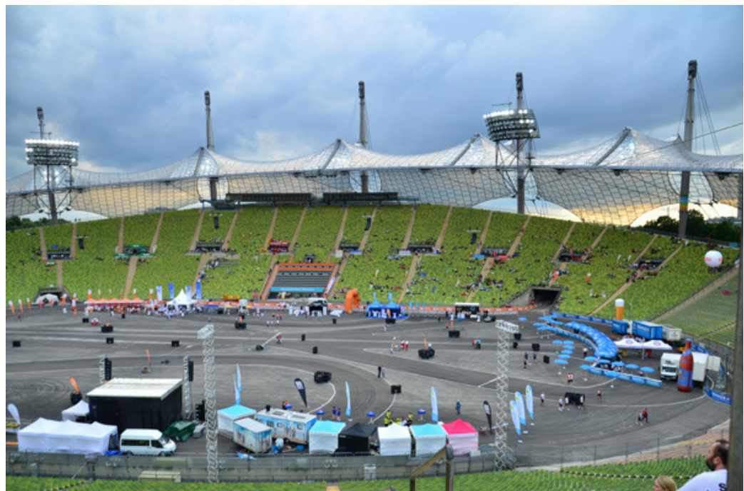
Auch im Stadion.