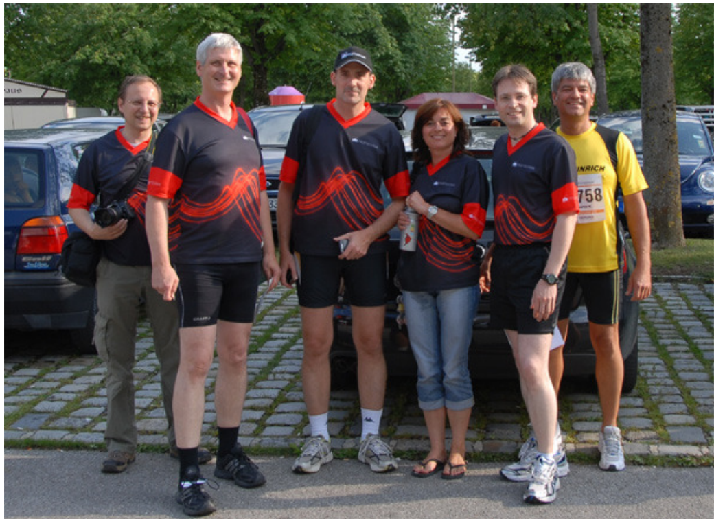
Die Anreise bereitete uns auf die überfüllte Laufstrecke vor.

Die nachfolgenden Eindrücke wurden dankenswerterweise von Annette Niebert und Peter Krahulik festgehalten.