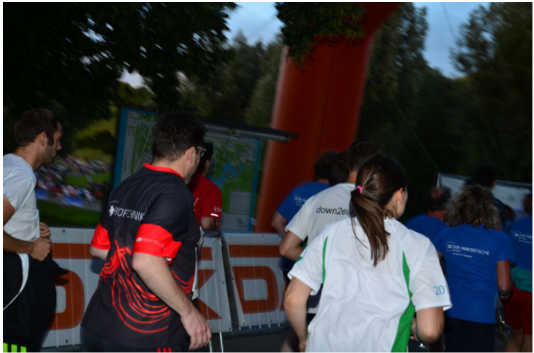
Auch Andere sind so schnell, daß man sie nur von hinten fotografieren kann.