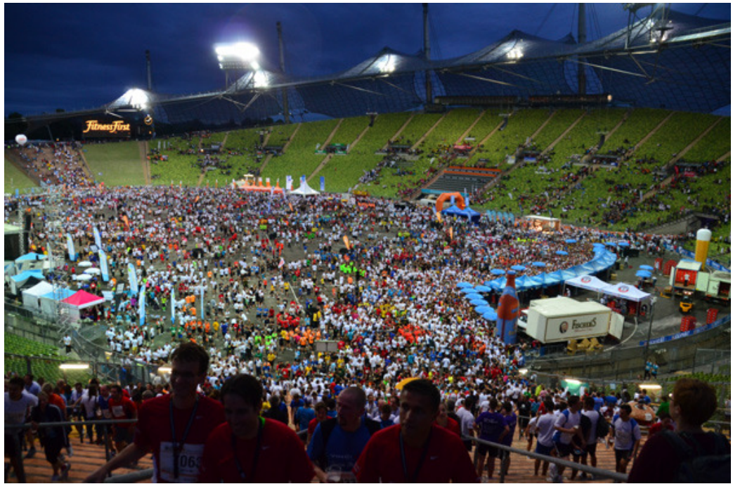
Allerdings erst nach dem Anstehmarathon