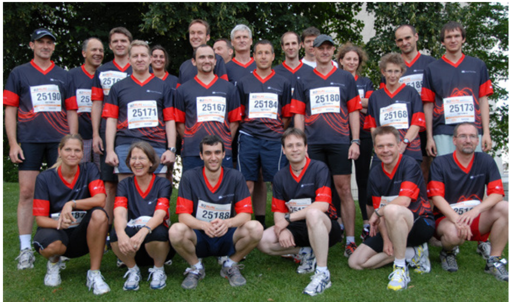
Am Berg noch ganz brav...